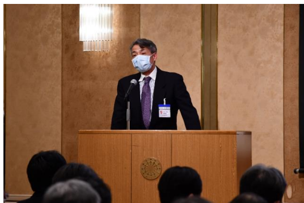
開会挨拶(向井病院長)