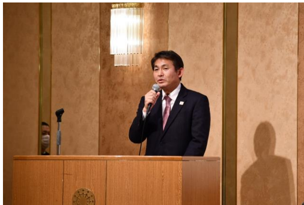
来賓ご挨拶(八王子市長 初宿 様)